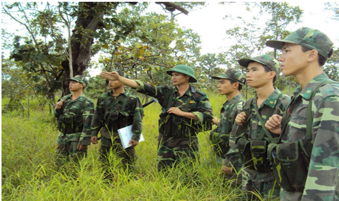
(Bộ đội Biên Phòng canh giữ bình yên cho nhân dân biên giới)

mặt. Các thế hệ cán bộ, chiến sĩ BĐBP luôn thấm nhuần lời dạy của Bác Hồ kính yêu về tinh thần cần, kiệm, liêm, chính, dũng cảm, trung thành với Đảng, tận tụy với nhân dân; luôn hoàn thành xuất sắc mọi nhiệm vụ được giao, góp phần bảo vệ vững chắc độc lập, chủ quyền thống nhất và toàn vẹn lãnh thổ của Tổ quốc.