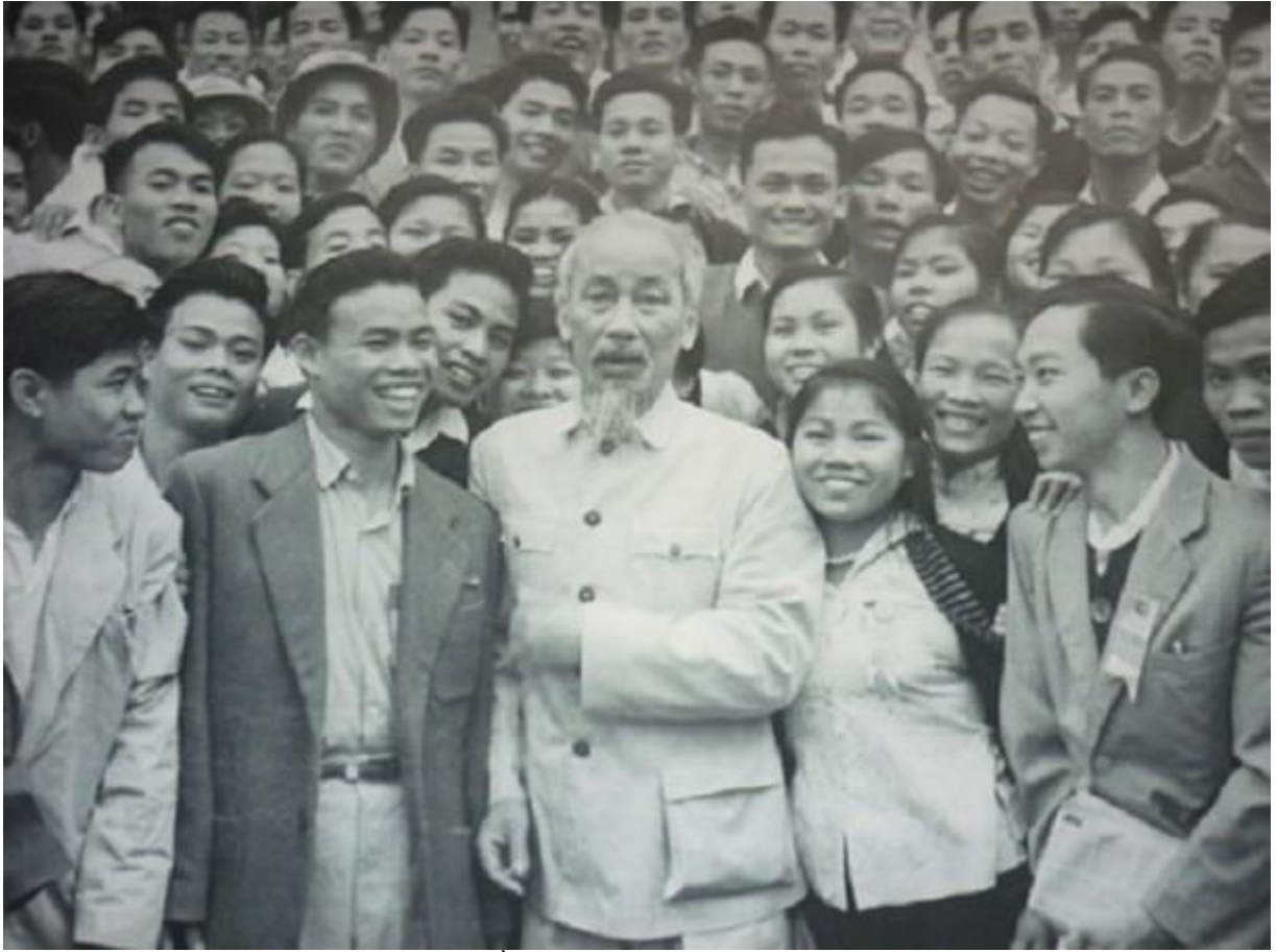
Bác Hồ với thanh niên Việt Nam.

Sinh thời, Chủ tịch Hồ Chí Minh luôn coi trọng việc giáo dục đạo đức cho đoàn viên, thanh niên. Nhìn nhận đoàn viên, thanh niên một cách toàn diện, thấy rõ vị trí, vai trò "Là người tiếp sức cho thế hệ thanh niên già, đồng thời là người phụ trách dìu dắt thế hệ thanh niên tương lai". Do vậy, Người đặc biệt quan tâm tổ chức, bồi dưỡng đoàn viên thanh niên thành đội xung kích cách mạng, lực lượng hậu bị của Đảng nhằm kế tục trung thành và xuất sắc sự nghiệp của giai cấp và dân tộc.