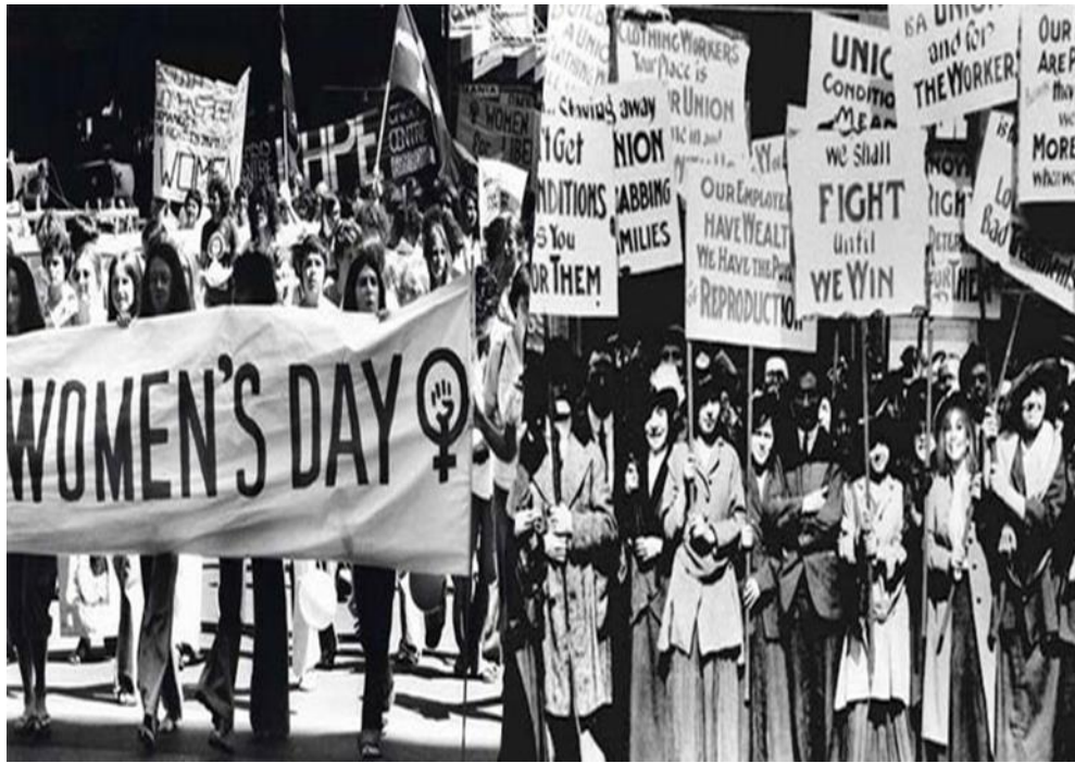
Buổi biểu tình lịch sử ngày quốc tế phụ nữ 8 tháng 3 năm 1899

Cảm phẫn trước sự bất công đó, ngày 8/3/1857, nữ công nhân nước Mỹ đã đứng lên đấu tranh đòi tăng lương, giảm giờ làm. Phong trào bắt đầu từ nữ công nhân ngành dệt và ngành may tại hai thành phố Chi-ca-gô và New York. Mặc dù bị bọn tư bản thẳng tay đàn áp, chị em vẫn đoàn kết chặt chẽ, bền bỉ đấu tranh buộc chúng phải nhượng bộ. Cuộc đấu tranh của nữ công nhân Mỹ đã cổ vũ mạnh mẽ phong trào phụ nữ lao động trên thế giới. Trong phong trào đấu tranh giai cấp lúc đó đã xuất hiện hai nữ chiến sĩ lỗi lạc, đó là bà Cla-ra Zet-kin (Clara Zetkin người Đức) và bà Rô-gia Lú-xăm-bua (người Ba Lan). Nhận thức được sự mạnh mẽ và đông đảo của lực lượng lao động nữ và sự cần thiết phải có tổ chức, phải có lãnh đạo để giành thắng lợi cho phong trào phụ nữ, nên năm 1907 hai bà đã cùng phối hợp với bà Crup-xkai-a (vợ đồng chí Lê-nin) vận động thành lập Ban “Thư ký phụ nữ quốc tế”. Bà Cla-ra Zet-kin được cử làm Bí thư.