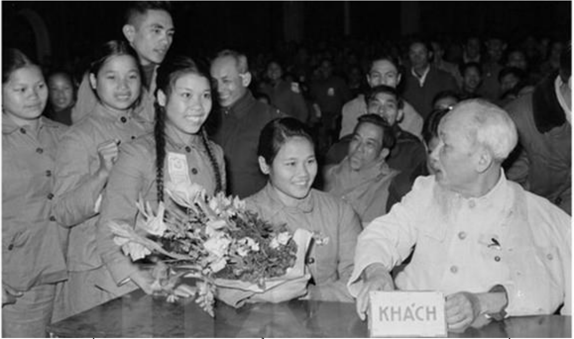
Chủ tịch Hồ Chí Minh nói chuyện với đại biểu thanh niên xung phong dự Đại hội TNXP chống Mỹ cứu nước toàn miền Bắc tháng 1/1967.

Thấm nhuần và quán triệt tư tưởng của Người, Đảng và Nhà nước ta luôn đề cao vai trò của đoàn viên, thanh niên. Coi đây là lực lượng xung kích, là đội dự bị tin cậy của Đảng và coi công tác thanh niên là vấn đề được đặc biệt quan tâm chỉ đạo. Sự nghiệp đời mới có thành công hay không, đất nước có vị trí xứng đáng trong cộng đồng thế giới hay không phần lớn phụ thuộc vào lực lượng đoàn viên, thanh niên, vào việc bồi dưỡng, rèn luyện thế hệ thanh niên.