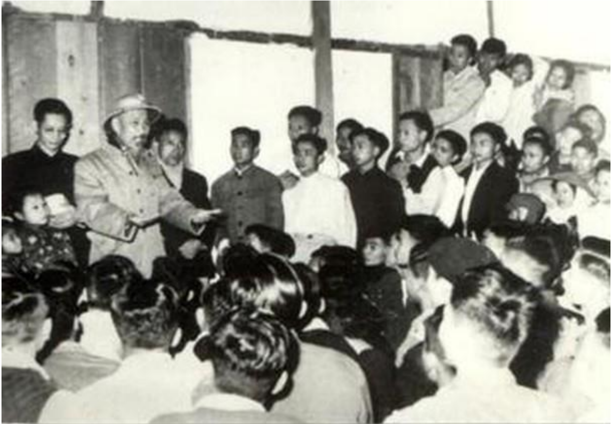
Bác Hồ nói chuyện với cán bộ và sinh viên Bách khoa tại nhà ở sinh viên sáng mừng Một Tết Mậu Tuất - năm 1958.

Thương yêu hết lòng và đặt niềm tin trọn vẹn vào đoàn viên, thanh niên, Người nhấn mạnh: "Thanh niên sẽ làm chủ nước nhà. Phải học tập mãi, tiến bộ mãi mới thật là thanh niên ". Trước lúc đi xa, Người đã để lại cho đoàn viên, thanh niên "Muôn vạn tình thương yêu", Người đánh giá: "Đoàn viên thanh niên ta nói chung là tốt, mọi việc đều hăng hái xung phong, không ngại khó khăn, có chí tiến thủ"; và căn dặn "Đảng cần phải chăm lo giáo dục đạo đức cách mạng cho họ, đào tạo họ thành những người thừa kế xây dựng CNXH vừa "hồng" vừa "chuyên".