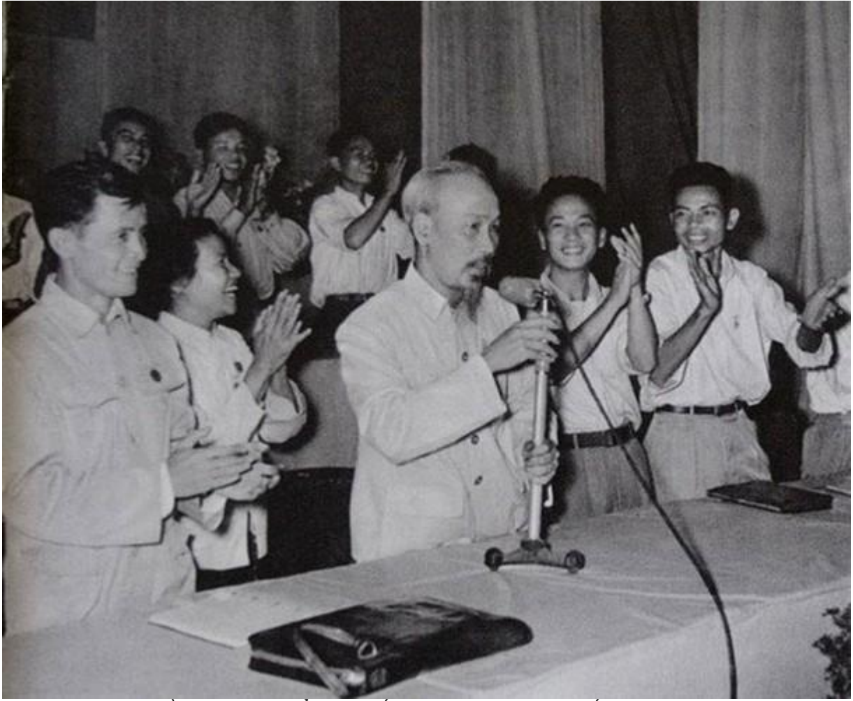
Bác Hồ tại Đại hội đại biểu toàn quốc Đoàn Thanh niên Cứu quốc 1956 tại Hà Nội.

Đạo đức cách mạng ấy là sự triệt để trung thành với cách mạng, một lòng, một dạ phục vụ nhân dân, sẵn sàng xả thân cho đất nước, điều đó được thể hiện ở ngay trong suy nghĩ và hành động hàng ngày của mỗi đoàn viên, thanh niên. Để tuổi trẻ trở thành người cách mạng chân chính, những con người mới XHCN, Người nhấn mạnh việc cần thiết phải giáo dục đoàn viên, thanh niên tính trung thực, ngay thẳng, tác phong khiêm tốn, giản dị, tinh thần lao động tích cực, siêng năng, táo bạo và sáng tạo. Đoàn viên, thanh niên phải luôn có tinh thần cố gắng vươn lên, sống cần kiệm liêm chính, chí công vô tư, luôn đặt lợi ích của Đảng, của dân tộc lên trên hết, phải thực hành tự phê bình và phê bình nghiêm chỉnh để giúp đỡ nhau cùng tiến bộ.