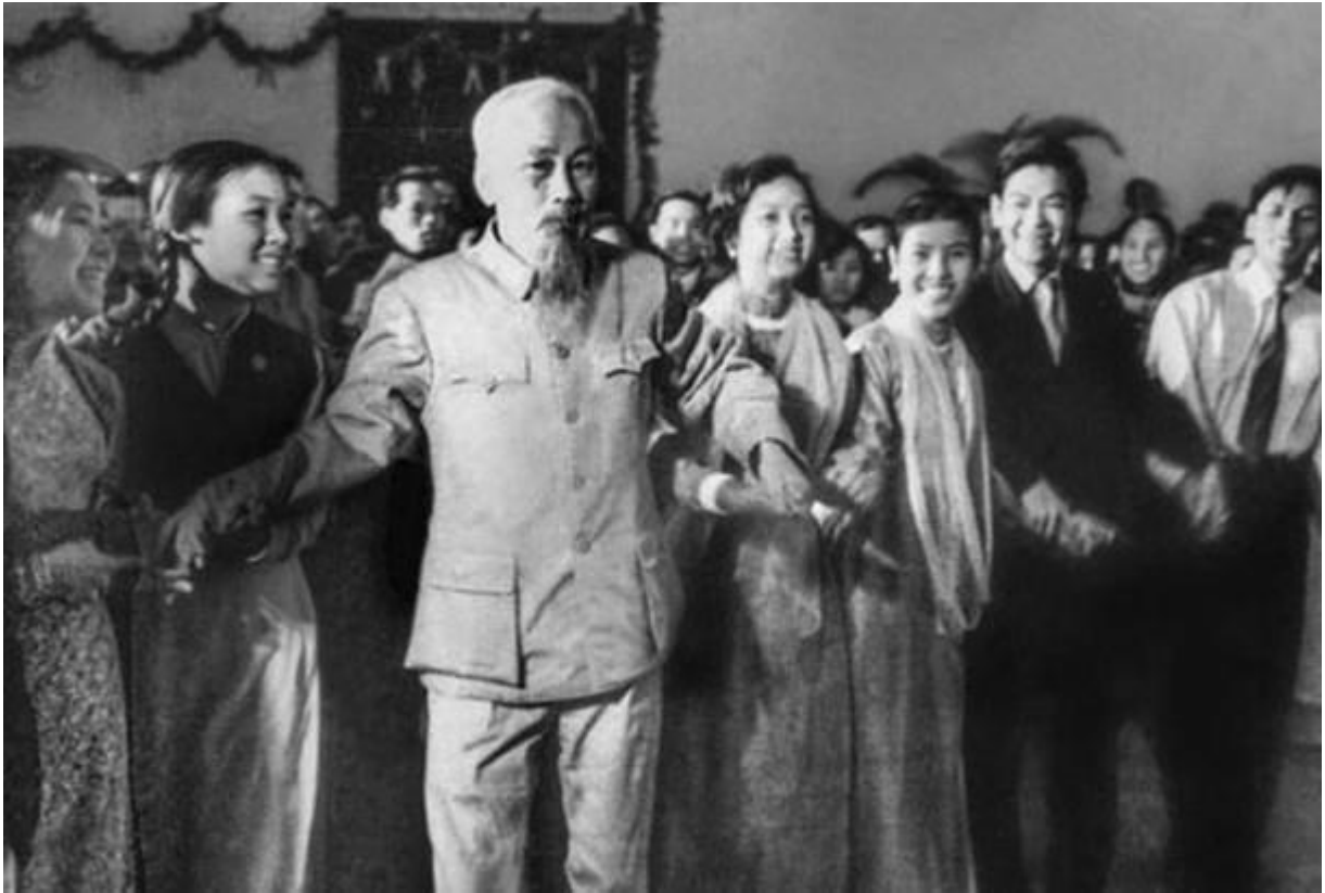
Bác Hồ với thanh niên Thủ đô.